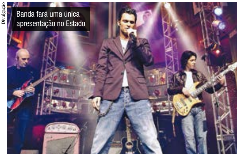
Banda fará uma única apresentação no Estado

Sucessos do grupo foram e ainda são prestigiados por jovens de todas as idades há mais de 30 anos