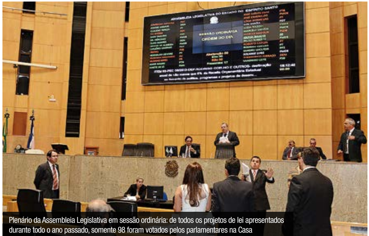
Plenário da Assembleia Legislativa em sessão ordinária: de todos os projetos de lei apresentados durante todo o ano passado, somente 98 foram votados pelos parlamentares na Casa

Segundo ele, quando falta interesse por parte dos próprios parlamentares, os projetos tendem a estacionar, independentemente do assunto por eles tratado.