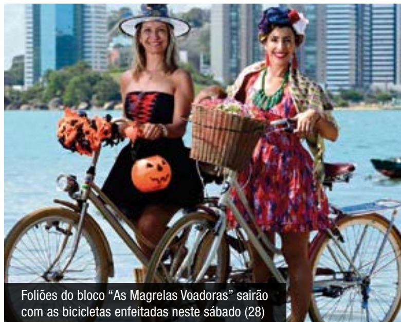
Foliões do bloco "As Magrelas Voadoras" sairão com as bicicletas enfeitadas neste sábado (28)

Já em Vila Velha, na Barra do Jucu, a animação começará no dia 18 de fevereiro, com o desfile do tradicional Bloco da Lama, a partir das 16 horas. O evento é aberto ao público.