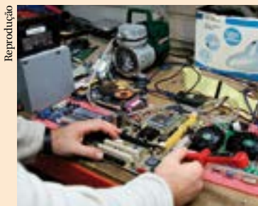
Manutenção de computadores aparece como uma área promissora