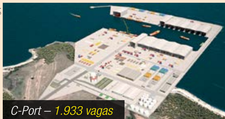
C-Port – 1.933 vagas

■ O projeto do complexo industrial portuário em Presidente Kennedy aguarda para os próximos dois meses a Licença de Instalação do Ibama.