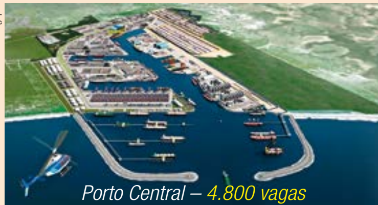
Porto Central – 4.800 vagas