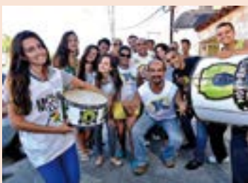
Kustelão, em Jardim Camburi: com folia aberta ao público, bloco sai no dia 11 de fevereiro pelas ruas do bairro