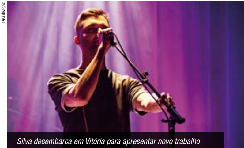
Silva desembarca em Vitória para apresentar novo trabalho

Cantor capixaba interpreta sucessos da cantora carioca, nesta quinta-feira, no Teatro Universitário