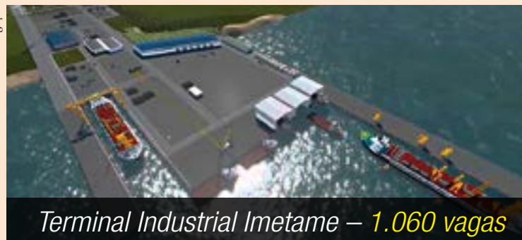
Terminal Industrial Imetame – 1.060 vagas