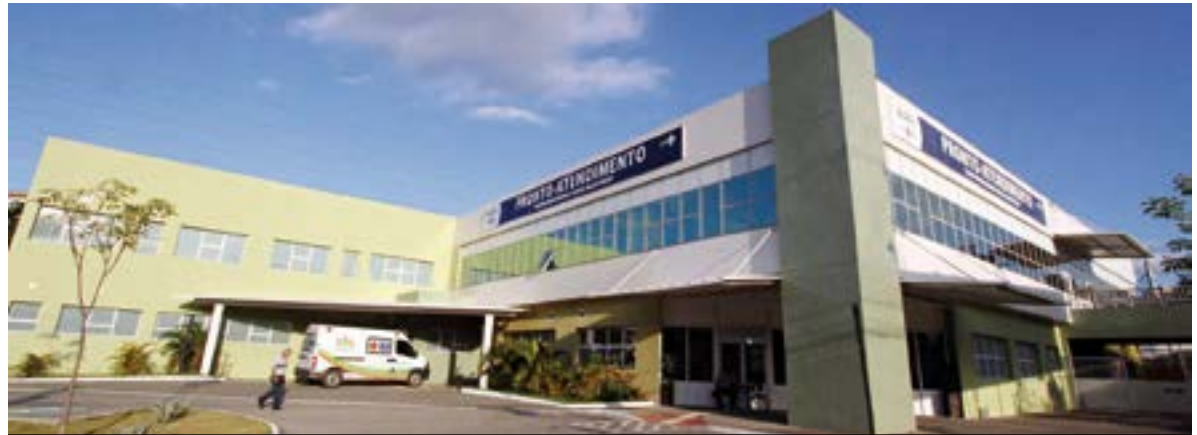
De acordo com a Prefeitura de Cariacica, o melhor horário para ir ao PA de Alto Lage é antes das 10h e após as 22h30

É impossível prever a hora de ficar doente, mas a prevenção é a melhor forma de evitar um atendimento em pronto-atendimen-