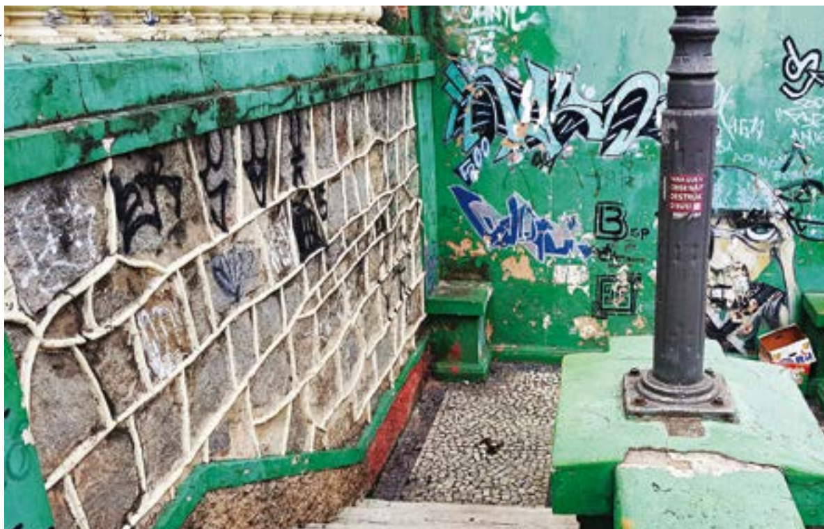
Escadaria na Av. Jerônimo Monteiro tem diversas pichações, o que tira a beleza do local

Porta de aço, janelas, muros, bancas de revistas e monumentos históricos. Quem passa pelo centro de Vitória percebe que esses espaços estão tomados por pichações, que geralmente acontecem no fim do expediente, depois que as lojas fecham.