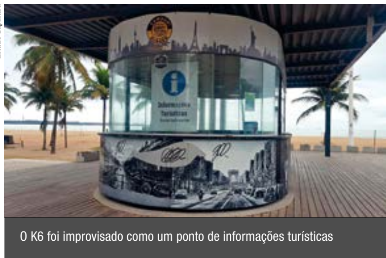
O K6 foi improvisado como um ponto de informações turísticas

ço é frequentemente ocupado por moradores de rua, de acordo com a população do bairro.