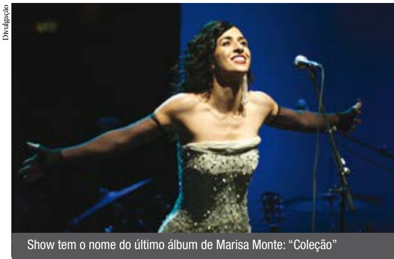
Show tem o nome do último álbum de Marisa Monte: "Coleção"

Marisa Monte apresenta na capital no próximo sábado (3) o único show do ano marcado no Brasil