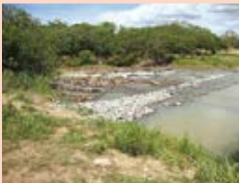
Rio Santa Maria, um dos que abastecem a região metropolitana, também é afetado pela seca