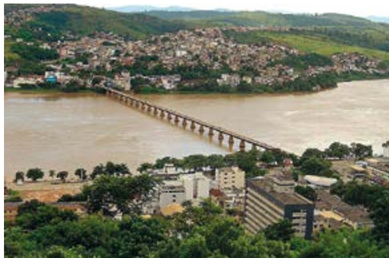
Vista aérea de Colatina, onde oito nomes irão disputar a prefeitura

Em 2016, durante a campanha para as eleições de outubro, 269 candidatos concorrem para prefeito no Estado. No País, são 14.687 postulantes. Estas informações são do Tribunal Superior Eleitoral (TSE).