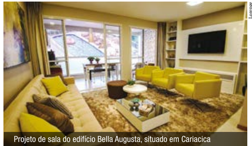
Projeto de sala do edifício Bella Augusta, situado em Cariacica

Estarão no evento, muitos imóveis em localidades que passam por uma fase de valorização, como os bairros de Itapuã e Itaparica, em Vila Velha; Jardim Camburi e Bento Ferreira, em Vitória.