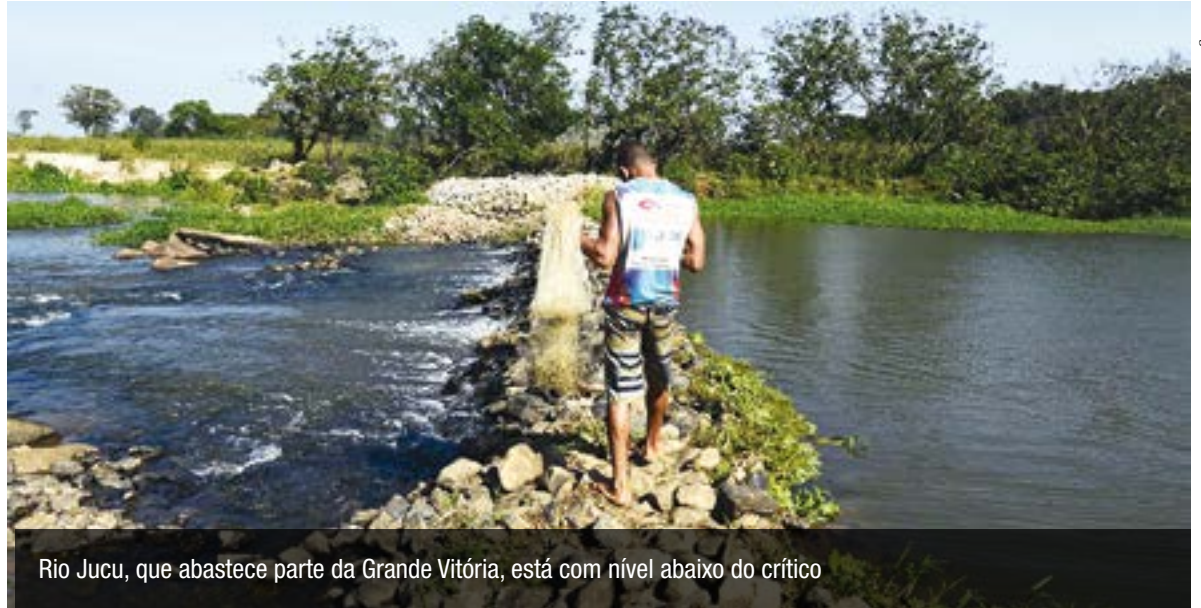
Rio Jucu, que abastece parte da Grande Vitória, está com nível abaixo do crítico

Ele contou que as regras devem conduzir a água para usos relevantes, como o consumo humano e criação de animais. “É necessário que se tenha água para a agricultura e indústria. Tem de definir critérios, com horários, dias e