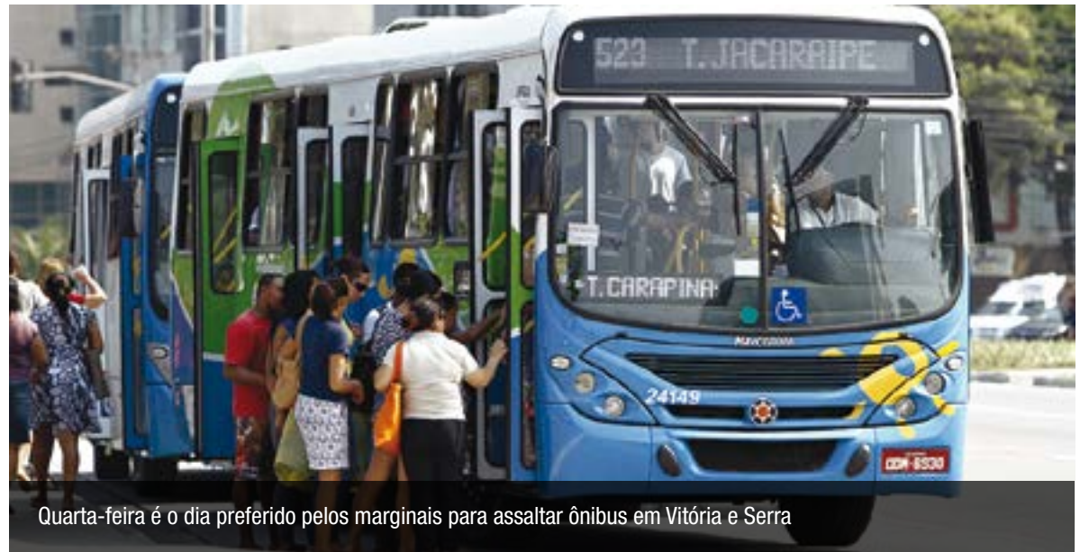
Quarta-feira é o dia preferido pelos marginais para assaltar ônibus em Vitória e Serra