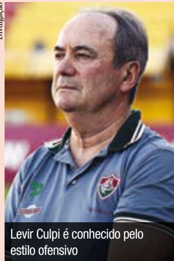
Levir Culpi é conhecido pelo estilo ofensivo