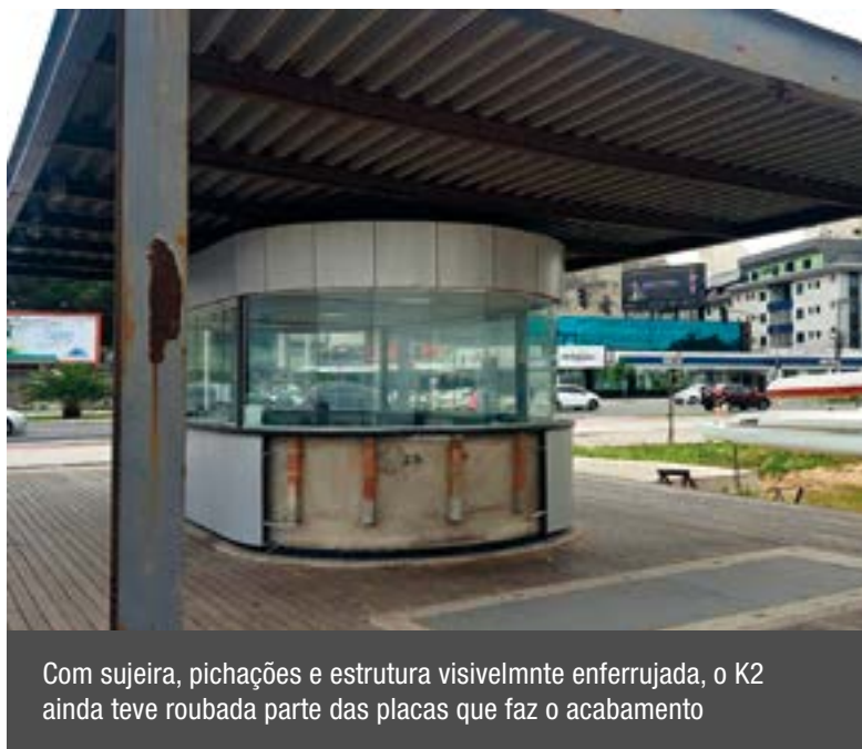
Com sujeira, pichações e estrutura visivelmente enferrujada, o K2 ainda teve roubada parte das placas que faz o acabamento

O descaso com os quiosques acontece após a polêmica com o valor do aluguel cobrado pela prefeitura e estabelecido em R$ 6,5 mil, publicado no edital de licitação. Com as receitas conquistadas, os comerciantes que ocupam os sete imóveis na orla garantem, há três anos, terem muitas dificuldades para honrar com os aluguéis.