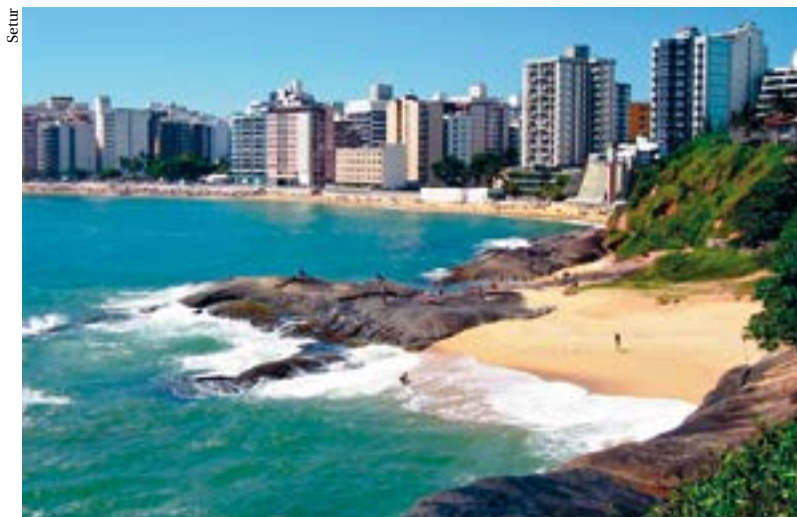
Guarapari apresenta o maior número de candidatos na Grande Vitória

As cidades do Estado onde há maior competição para as prefeituras são Colatina e Guarapari