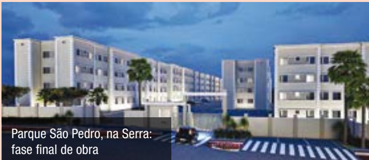
Parque São Pedro, na Serra: fase final de obra